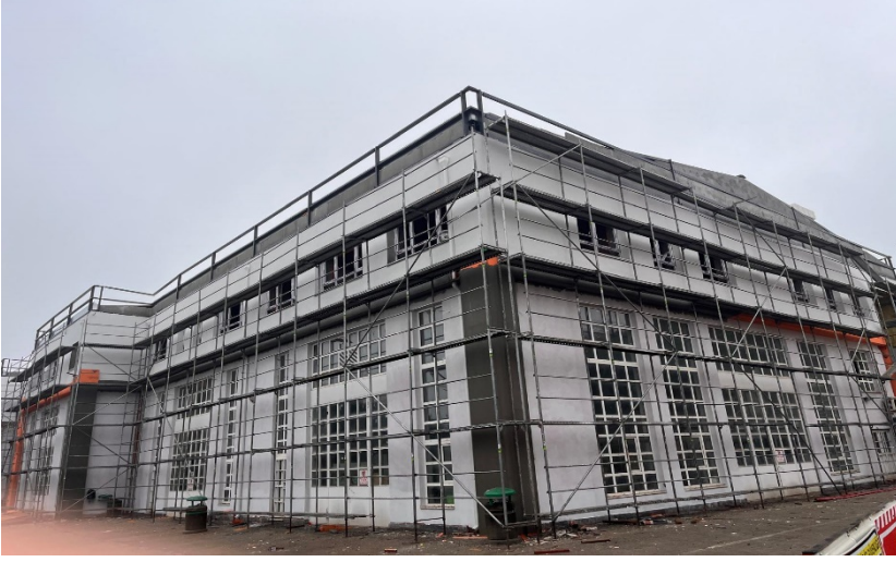
PAMUKOVA KANTİN, YEMEKHANE VE LABORATUVAR YAPIMI İŞİ (YAPIMI DEVAM ETMEKTEDİR.)